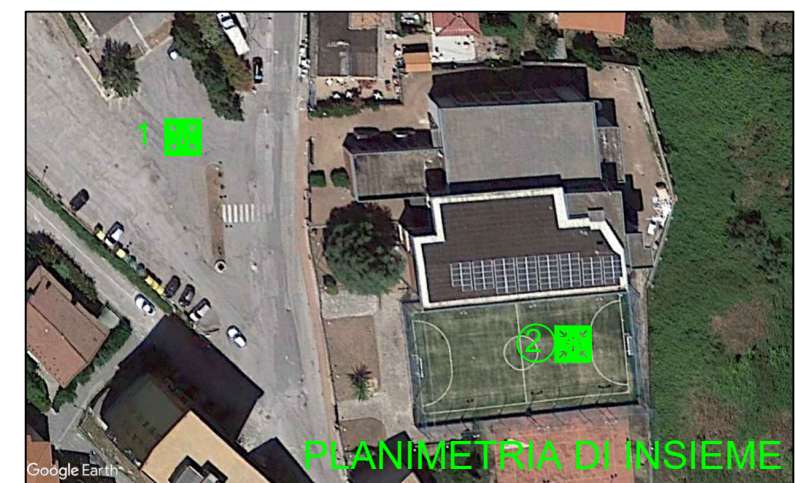
PLANIMETRIA DI INSIEME

-Mantenere la calma: non lasciarsi prendere dal panico -Trovare luoghi di riparo da oggetti in caduta libera senza creare confusione: sotto il banco o addossati alla parete, lontano da finestre ed armadi Dopo la scossa, all'ordine di evacuazione, abbandonare ordinatamente l'ambiente seguendo le procedure di evacuazione previste